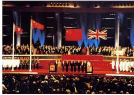
中英香港政权交接仪式