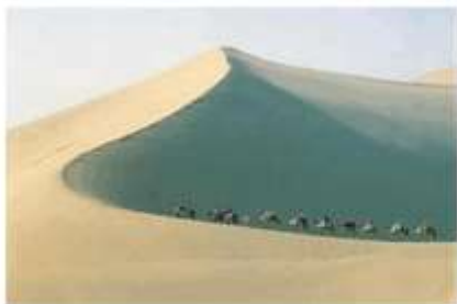
丝绸之路上的商队

2. 某历史兴趣小组进行研究性学习，收集到一些资料。下面这组图片资料体现的主题是（ ）