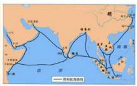
郑和下西洋路线图