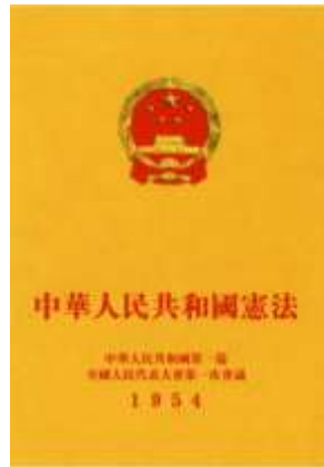
1954年颁布的第一部《中华人民共和国宪法》封面