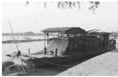
图1 开天辟地 党的诞生