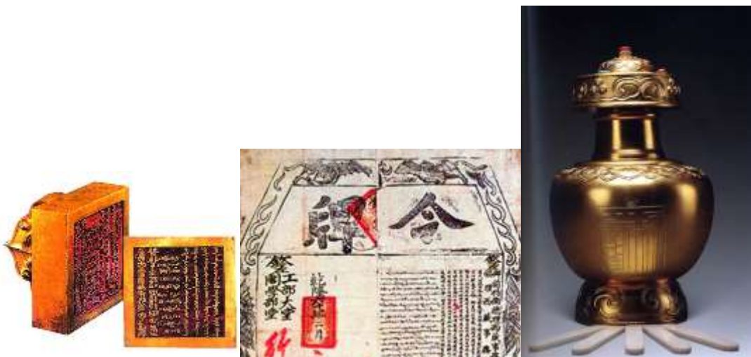
达赖五世金印 驻藏大臣令牌（局部） 金瓶