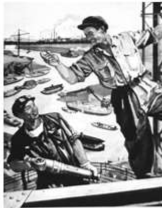
把祖國建設得更美麗