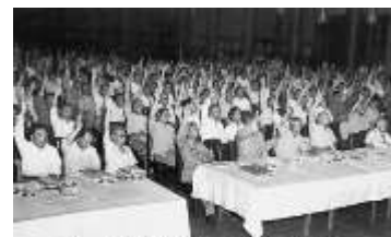
第一届人民代表大会会场