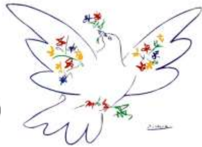
图三 《和平鸽》(毕加索)

(1) 材料一中图一反映的是什么历史事件？（1分）有人认为没有这一事件就没有第一次世界大战。结合所学知识给予驳斥。（2分）