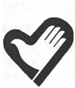
中国青年志愿者标志

6. 观察下面两幅图，根据其主要内容，写出你的感受。要求主题明确，语句通顺，不少于60字。