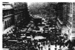
1929年美国华尔街股市崩盘

材料三 2008年4月源自美国的次贷危机,迅速波及全球,形成一场史无前例的金融海啸。