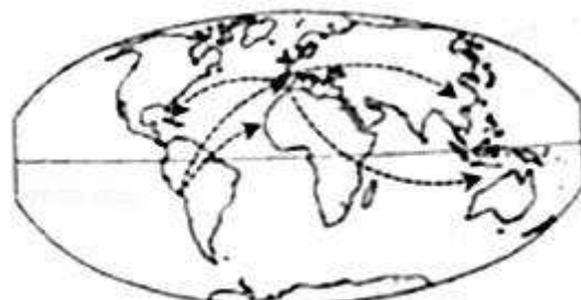
马铃薯传播路线示意图

1939年美国出台《市场推广法案》，依据法案成立了国家马铃薯委员会，进行贸易立法和纠纷的解决；各州根据不同的气候和土壤条件，选择种植不同用途的马铃薯；专门成立研究中心，进行新品种培育、深加工处理、化肥农药使用量、节水等研究。