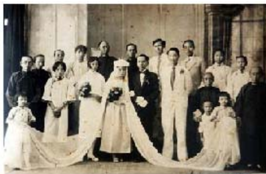
民国时期的西式婚礼