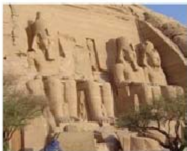
尼罗河流域阿布辛贝勒神殿