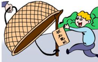
别人的笔记未必适合你