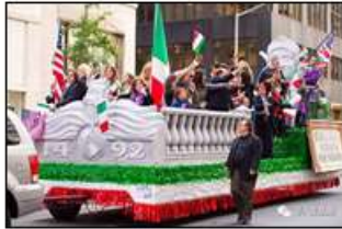
纽约市举行盛大游行庆祝哥伦布日

19. 图中所庆祝的纪念日，最早在 1937 年由美国总统富兰克林·罗斯福宣布为每年的 10 月 12 日。自 1971 年开始，此纪念日被正式定于 10 月的第二个星期一。此节日的设立，主要是为了纪念哥伦布（ ）