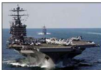
杜鲁门号航空母舰