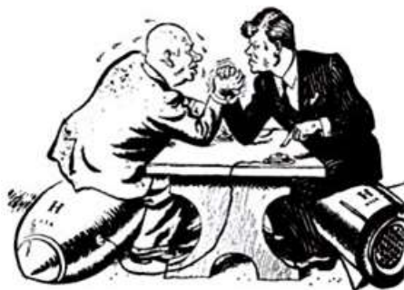
赫鲁晓夫和美国总统肯尼迪的较量(漫画)

24. 如图所反映的事件被看作是冷战的顶峰和转折点，在世界史上人类从未如此近地站在一场核战争的边缘，这个事件是（ ）