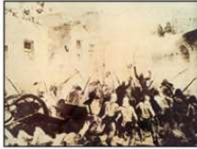
起义者英勇抗击英国军队

21. 如图反映的历史事件是 19 世纪中期的一场声势浩大的民族大起义。这场起义发生于( )