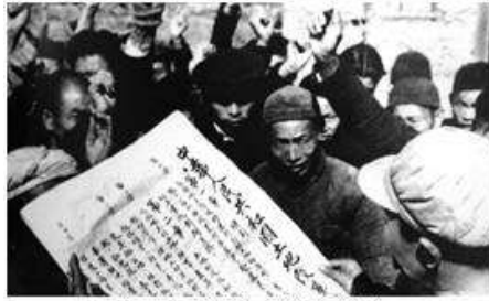
向农民宣传土地改革法

13. 图中所宣传的法律性文件颁布实施后，对中国社会所产生的巨大影响不包括（ ）