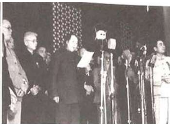
图二 中华人民共和国开国大典