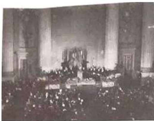
图一 北大西洋公约组织成立