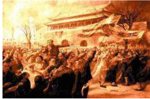
图十一 1919 年五四运动