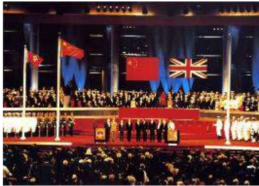
图十四 中英香港政权交接仪式

(6) 根据材料二，请说出邓小平为实现祖国统一和维护中华民族的根本利益而提出的伟大构想是什么？（2分）