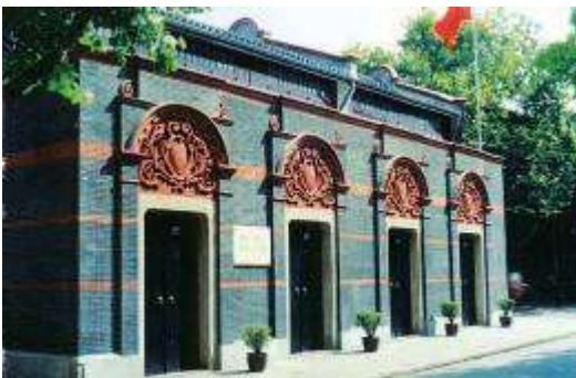
图十二 中共一大会址