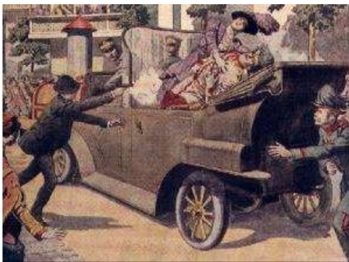
图一 萨拉热窝事件