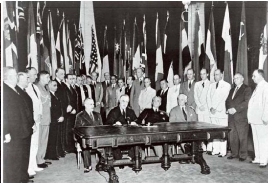
图二 《联合国宣言》签署