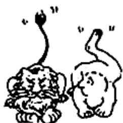
《学习先进经验》 (赵汀阳, 《读书》)