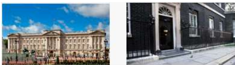
图8 白金汉宫（左）和唐宁街10号（右）， 自18世纪中期至今分别为英国王宫和首相府邸。