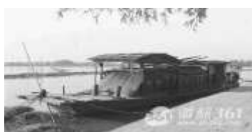
图 1: 开天辟地 党的诞生