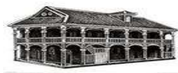
图 2: 生死攸关 历史转折

材料二: 【党的探索亘古未有】20 世纪 50 年代中国共产党领导中国人民走上社会主义道路, 由此开始了中华民族在社会主义道路上实现伟大复兴的历史征程。……经过 20 多年的探索和建设, 新中国不仅赢得了政治上的独立, 人民民主专政的国家制度已经建立, 以十一届三中全会为起点, 中国进入了改革开放和现代化建设的历史新时期。1979 年, 中国农民以特有的首创精神奏响了改革的序曲。