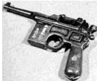
图2中，手枪上有两行字：“南昌暴动纪念”，“朱德自用”。

1949年4月21日，毛泽东、朱德向人民解放军发布了《向全国进军的命令》，百万人民解放军在西起江西湖口，东到江苏江阴的500多千米的战线上，分西、中、东三路强渡长江。