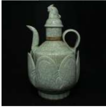
图1 南宋景德镇瓷器