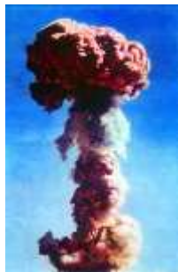
C. 中国第一颗原子弹爆炸成功