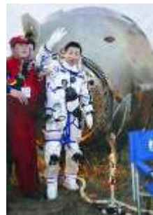
D. “神舟五号”载人航天飞行圆满成功

22. 从 1868 年起，明治政府在“富国强兵，殖产兴业，文明开化”的口号下进行改革。对这次改革的下列评述，不正确的是