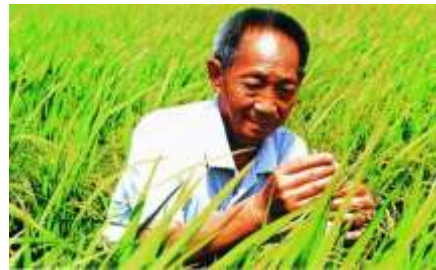
B. 籼型杂交水稻培育成功