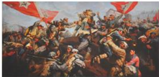
图二 红军三大主力会师 (油画)

(2)新中国成立时，年轻的共和国面临着严峻的国际国内形势。中共中央毅然决定出兵抗美援朝的主要目的是什么？同时，为实现农民的彻底解放，我国在新解放区开展了什么运动？