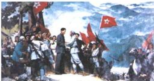
图一 井冈山会师 (油画)

(1)指出在图一所反映的历史事件发生后，形成的中国工农红军第一支坚强部队的名称。两幅图片所反映的历史事件有何共同的历史作用？