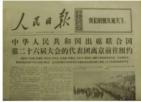
图 2:《人民日报》关于中国代表团参加第 26 届联合国大会的报道

材料三 新中国 30 年来的对外关系是在独立自主前提下新型外交的历史，是不断向上发展且不断取得巨大成就的历史，是一部支持被压迫民族争取独立解放的历史，是一部反对霸权主义，执行和平外交政策的历史。30 年的外交增进了与世界各国、各地区的友谊，为我国的社会主义建设赢得了和平宽松的国际环境。