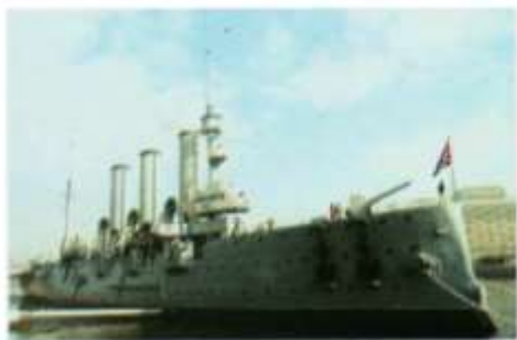
“阿芙乐尔号”巡洋舰

16. 在一个寒冷的夜晚，军舰上（图左）的大炮发出了震撼世界的怒吼，起义部队潮涌般冲进反动政府最后的堡垒（图右），一个新的时代来临了。这件事发生于（ ）