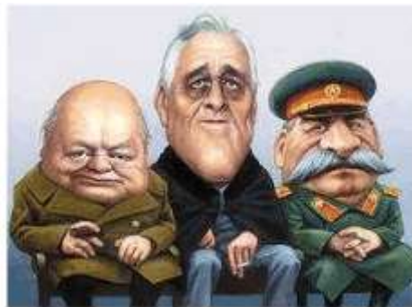
雅尔塔会议“三巨头”漫画

18. 如图漫画描绘的是 1945 年苏美英三国首脑在雅尔塔会议上的场景。这次会议的主要议题是（ ）