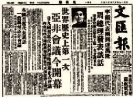
图 1:《文汇报》关于周恩来率团参加万隆会议的报道