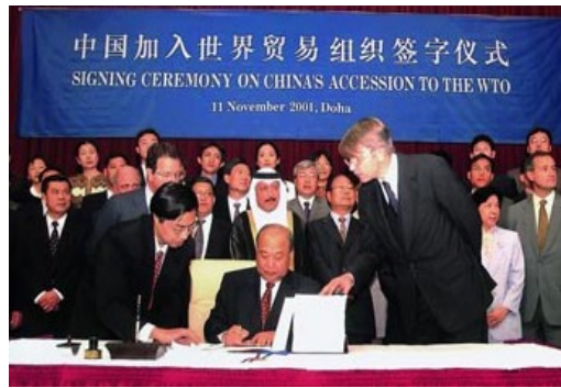
图一 美国麦道飞机国外零件供应地示意图 图二 中国加入世界贸易组织签字仪式