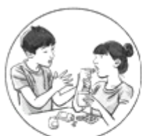
①自行加大药物服用剂量