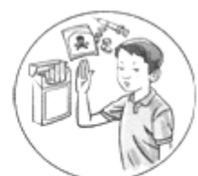
④远离有害物质(如香烟、毒品等)