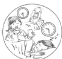
②有规律的作息和充足的睡眠