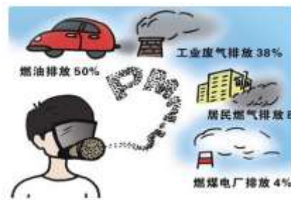
我国东部某市 8 月 PM2.5 来源构成

停产，依法处理空气质量保障不力的干部及污染责任人等措施，减少 PM2.5 的排放，使北京的天空出现了少有的清爽湛蓝。这不但让我们印证了雾霾产生的根源，也获得了治理雾霾的经验。