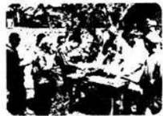
农民领取生产承包合同