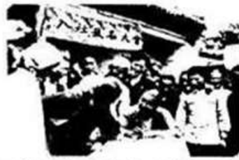
河北邯郸市郊农民报名入社