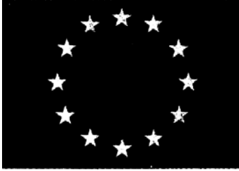
(注:蓝色底黄色星,十二颗星代表欧洲十二个国家)