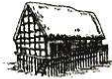
河姆渡人的干栏式建筑复原图