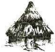
半坡居民半地穴式圆形房屋复原图