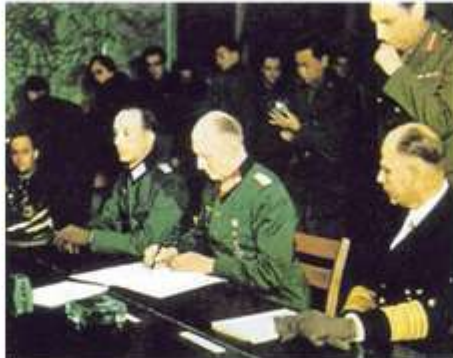
5月8日，德国代表签订 投降书