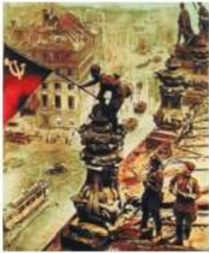
4月30日，苏军将红旗 插上德国国会大厦