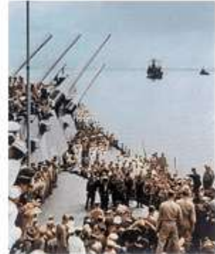
9月2日，日本政府向盟国 递交投降书