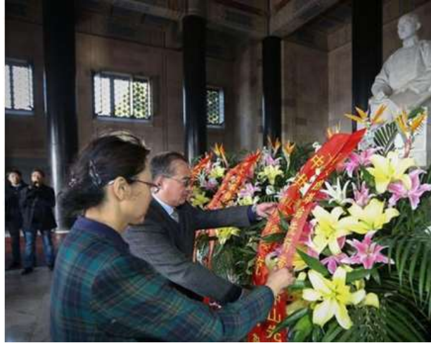
3月12日，南京各界人士拜谒中山陵