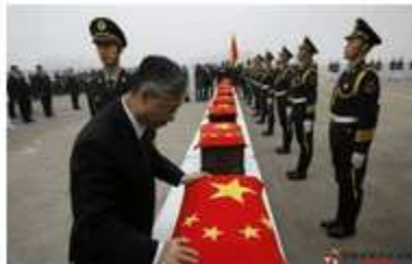
覆盖国旗的志愿军遗骸、遗物

8. 2015年3月20日，中韩双方对68具中国人民志愿军遗骸进行交接，使这些在朝鲜半岛沉睡了超过半个世纪的烈士得以“荣归故里”。当年，志愿军战士抗美援朝，保家卫国，被誉为（ ）